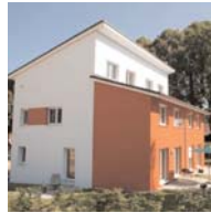
Doppelhaus in Hamburg-Heimfeld Büro AGP / ZÜBLIN AG