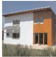
Einfamilienhaus in Hamburg-Wilhelmsburg denker.denker Architekten, Nils Denker