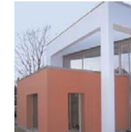
Doppelhaus in Götting / Kreis Lauenburg Architekturbüro Petra Merten