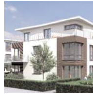
Mehrfamilienhaus in Hamburg-Bramfeld Konnex Projekt- und Planungsbüro