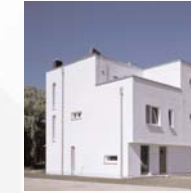
Reihenhaus in Hamburg-Wilhelmsburg Dipl.-Ing. Architekt Jan Krugmann