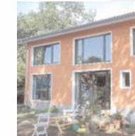
Einfamilienhaus in Hamburg-Iserbrook Dipl.-Ing. Architekt Dev K. Dockendorf