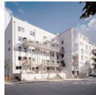
Mehrfamilienhaus in Hamburg-Eimsbüttel DR-Architekten Dittler & Reumshüssel