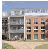
Mehrfamilienhaus in Hamburg-Eidelstedt Plan-R-Architektenbüro Joachim Reing