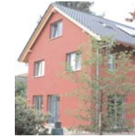
Doppelhaus in Hamburg-Schnelsen Dipl.-Ing. Architekt Robert Heinicke Dipl.-Ing. Architekt Nisse Gerster