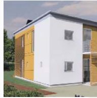
Reihenhaus in Hamburg-Wilhelmsburg Architekturbüro Petra Merten