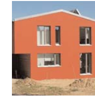
Einfamilienhaus in Hamburg-Marmstorf Dipl.-Ing. Architekt Robert Heinicke Dipl.-Ing. Architekt Nisse Gerster