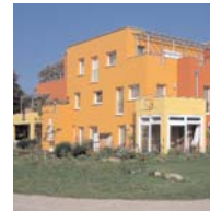
Mehrfamilienhaus in Ahrensburg Plan-R-Architektenbüro Joachim Reing