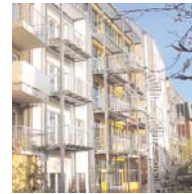
Mehrfamilienhaus in Hamburg-St. Pauli Andreas-Thomsen-Architekten