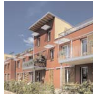
Mehrfamilienhaus in Hamburg-Lurup Huke-Schubert Berge Architekten