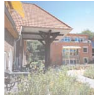
Mehrfamilienhaus in Hamburg-Iserbrook Dipl.-Ing. Architektin Christiane Gerth