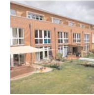
Reihenhäuser in Hamburg-Iserbrook Dipl.-Ing. Architektin Christiane Gerth