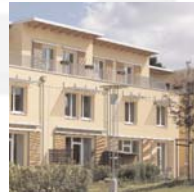
Klimaschutzsiedlung am Kornweg Neustadtarchitekten