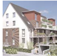
Mehrfamilienhaus in Hamburg-Volksdorf Konnex Projekt- und Planungsbüro