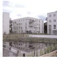
Mehrfamilienhaus in Hamburg-Stellingen Freie Architekten Werner und Nils Feldsien