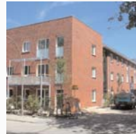
Mehrfamilienhaus in Hamburg-Heimfeld DR-Architekten Dittler & Reumshüssel