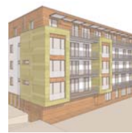
Mehrfamilienhaus in Hamburg-Eimsbüttel Neustadtarchitekten