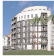
Mehrfamilienhaus in Hamburg-St. Pauli Plan-R-Architektenbüro Joachim Reing