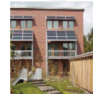
Reihenhaus in Hamburg-Lurup Dipl.-Ing. Architektin Christiane Gerth