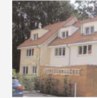
Reihenhaus in Hamburg-Farmsten Enno Klünder, Architekt HBK